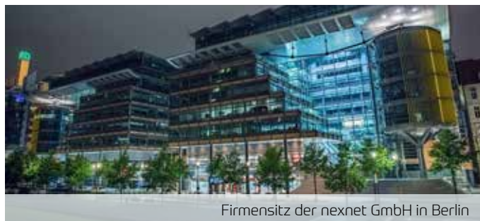
Firmensitz der nexnet GmbH in Berlin

Die zentrale IT-Plattform macht schnelle Produkt- und Tarifanpassungen jederzeit möglich und ein aufwendiges Setup überflüssig. Dabei steht die individuelle Funktionalität bei Sonderanforderungen des Kunden im Fokus. Mit der Systemplattform wird in Kombination mit leistungsfähigen SAP- und Oracle-Systemen – vollständig automatisiert – ein Höchstmaß an Prozesssicherheit erreicht. Aussagekräftige Tools für Reportings, Statistiken und Analysen sind zentraler Bestandteil der Plattform. Mit dem selbst entwickelten CRM-Modul können beliebige komplexe Datenmodelle abgebildet werden. Kunden profitieren von den schnellen und flexiblen Anpassungsmöglichkeiten sowie der Web-Oberfläche, die dynamisch aus dem Datenmodell generiert wird. Darüber hinaus können standardisierte Schnittstellen zu Provisionierungs- oder CRM-Systemen bereitgestellt werden. Hierfür kommen nur eigene, leistungsfähige und skalierbare Rechenzentren in Deutschland zum Einsatz. Qualitäts-Technologie „Made in Germany“ – dies bestätigt auch die DIN 9001 Zertifizierung in den Abrechnungsprozessen.